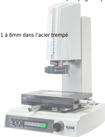
Mesure optique Smartscope