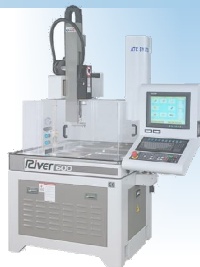
Centre de perçage rapide